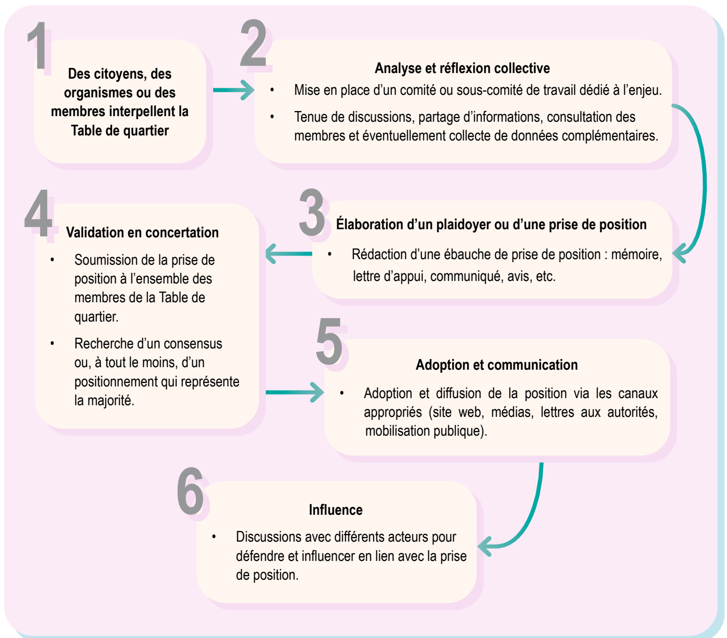
SCHÉMA DU CONTEXTE D'ACTION DES TABLES DE L'EST Émergence d'un enjeu urbanistique ou d'un projet d'aménagement

ou à définir de manière exhaustive l'action des Tables de quartier, qui est intrinsèquement variée et complexe. L'objectif est de démontrer comment ces rôles de base se succèdent en réponse à un événement particulier.